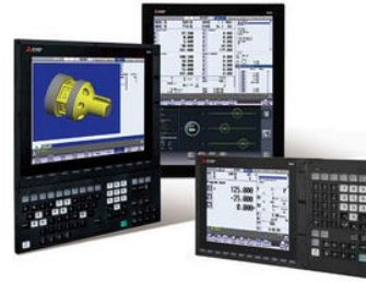
Control numérico Mitsubishi M80A