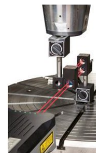
雷尼绍激光干涉仪 Renishaw laser interferometer

Tanque de almacenamiento neumático para garantizar la estabilidad en el cambio de herramienta