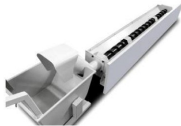
Extractor de viruta Extractor de viruta tipo tornillo