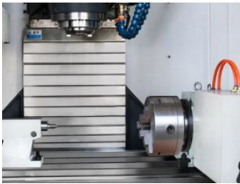
Mesa de 4to eje Incluye contrapunto manual