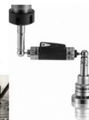
球杆仪 Renishaw ballbar