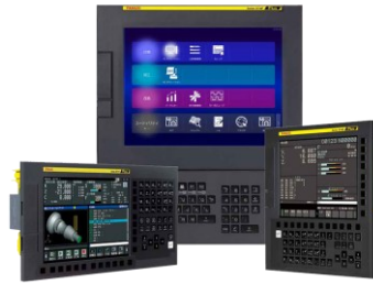
Control numérico Fanuc 0iMF plus

Centro de maquinado vertical, robusto, confiable, con gran precisión y un rendimiento excepcional