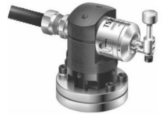
Renishaw TS27R Sonda de medición de herramienta Altura | Diámetro