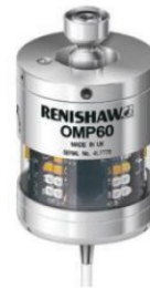
Renishaw OMP-40 | OMP-60 Sonda de medición de piezas