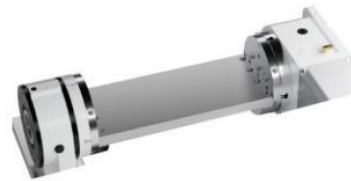
Mesa de fijación para 4to eje