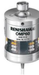
Renishaw OMP-40 | OMP-60 Sonda de medición de piezas