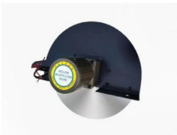
Separador de aceite