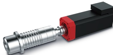
Direct drive spindle Acoplamiento directo 12,000 rpm | 15,000 rpm