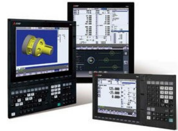
Control numérico Mitsubishi M80A