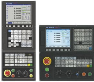
Control numérico GSK 25i

Centro de maquinado vertical, robusto, confiable, con gran precisión y un rendimiento excepcional