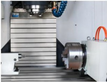
Mesa de 4to eje Incluye contrapunto manual